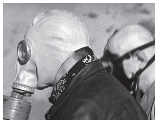
Misión a Marte.