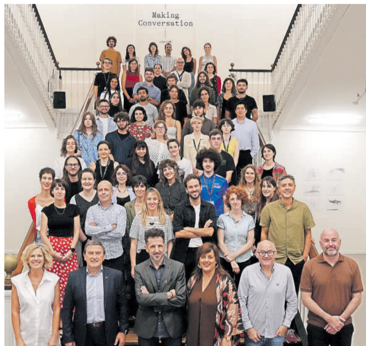
Representantes de Zine Eskola y SSIFF con las alumnas y alumnos del curso 2023-2024.